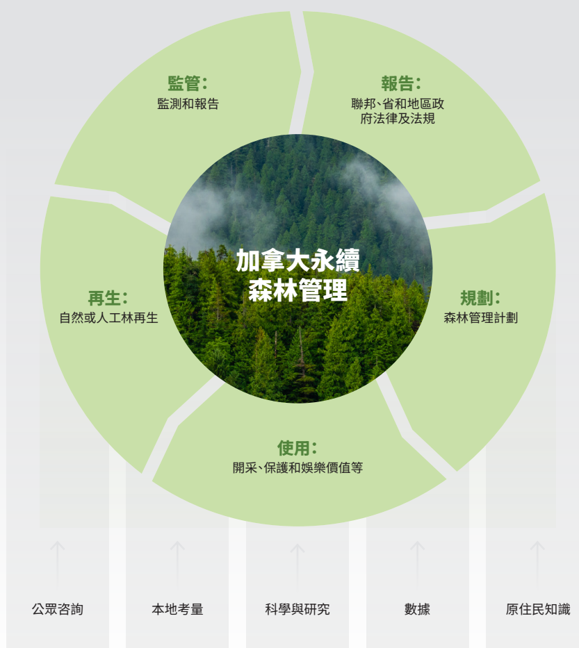
加拿大森林管理法規框架