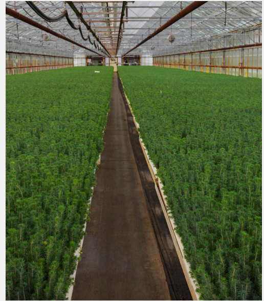
雲杉幼苗，Canfor

加拿大的森林覆蓋面積占全球森林面積的9%。加拿大有約2400萬公頃的受保護森林區，佔總森林面積的近7%。還有數百萬公頃的森林位於偏遠、難以接近的地區，因此在很大程度上不受人類活動的影響。此外，還有數百萬公頃的森林是為了特殊價值而進行管理，這些價值優先於林業或其他開發。